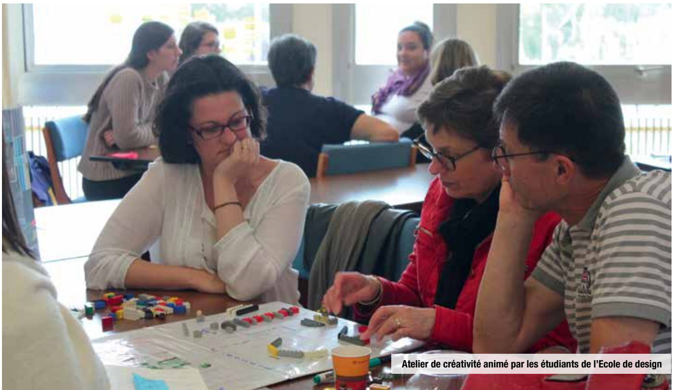
Atelier de créativité animé par les étudiants de l'Ecole de design

L'amélioration du service public et l'anticipation des nouveaux besoins de la population sont au cœur de l'action politique et du projet d'administration de la Ville. Modernité, innovation et co-construction sont les vecteurs d'un grand projet ayant vocation à améliorer l'accueil des habitants et à faciliter la réalisation de leurs démarches administratives.